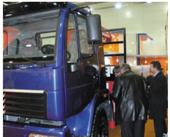
Дирекция Мосводоканала знакомится с автомобилями стенда АМО ЗИЛ