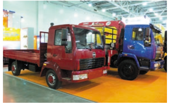
Будни выставки. Стенд АМО ЗИЛ.