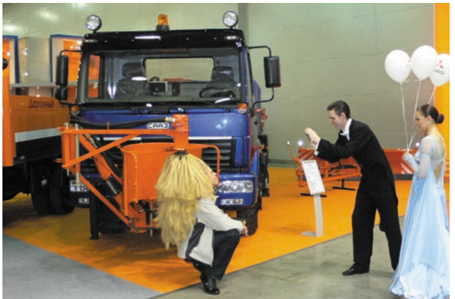
Универсальность машины дорожной комбинированной, созданной специалистами САЗ АМО ЗИЛ, по достоинству оценена даже рядовыми посетителями выставки КомТранс-2010.